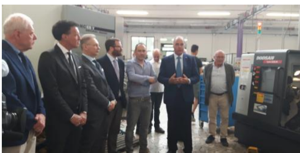
Insegnanti e imprenditori intervenuti per l'inaugurazione del tornio

Fare un passo di avvicinamento al mondo che produce è, del resto, la filosofia del San Gaetano. Un piccolo universo di 780 studenti, di cui il 30 per cento non italiani, suddivisi in cinque indirizzi: meccanico, automec-